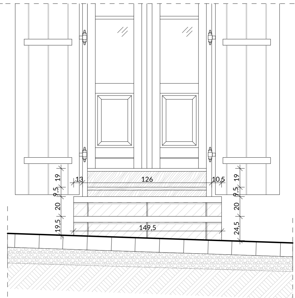
SCHODY WEJŚCIOWE DO LOKALU UŻYTKOWEGO NR 2 - EL. FRONTOWA (POŁUDNIOWA) - WIDOK OD STR. POŁUDNIOWEJ