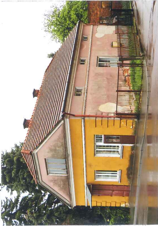
Widok ogólny od strony północno-zachodniej