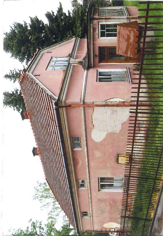
Widok ogólny od strony południowo-zachodniej