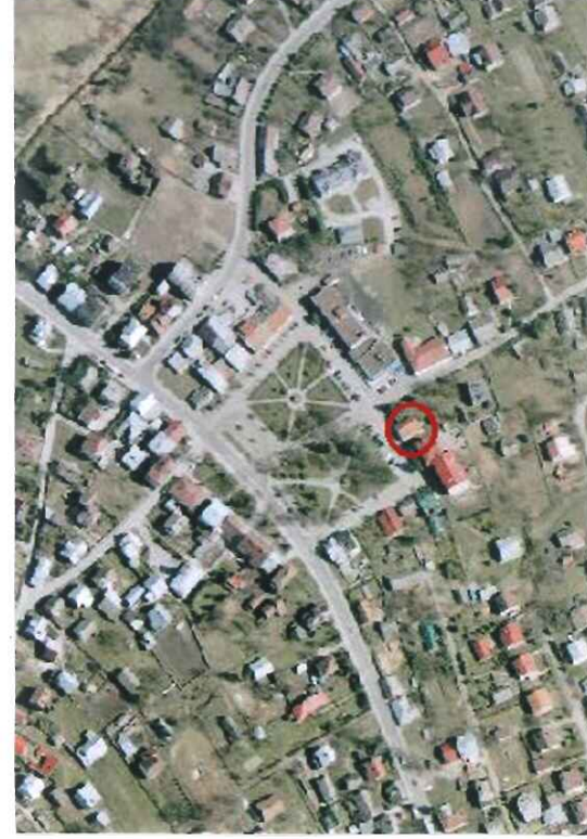
Mapa lokalizacyjna w skali 1:2500